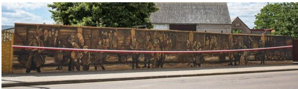
Mural zrealizowano przy współpracy ze Stowarzyszeniem Miłośników Ziemi Jedwabskiej

Na podstawie ustawy z dnia 24 kwietnia 2003 r. o działalności pożytku publicznego i o wolontariacie Rada Miejska w Jedwabnem Uchwałą Nr XXIII/193/20 z dnia 24 listopada 2020 r. przyjęła do realizacji w 2021 roku Program współpracy Gminy Jedwabne z organizacjami pozarządowymi oraz podmiotami wymienionymi w art. 3 ust. 3 ustawy z dnia 24 kwietnia 2003 r. o działalności pożytku publicznego i o wolontariacie.