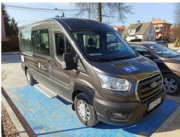
Usługa indywidualnego transportu door-to- door w Gminie Jedwabne

W 2022 r. przy Ośrodku Pomocy Społecznej funkcjonował Klub Integracji Społecznej . Z klubu skorzystało 11 osób. Dwie osoby podjęło zatrudnienie, dwie osoby pracowały na umowę zlecenie. Trzy osoby zostały skierowane na prace społeczno-użyteczne, w tym jedna osoba pracowała jako opiekunka domowa, trzy osoby zostały skierowane do Przedsiębiorstwa Gospodarstwa Komunalnego w Jedwabnem. Beneficjenci korzystają z punktu konsultacyjnego dla osób uzależnionych od alkoholu oraz członków ich rodzin oraz z porad pracowników socjalnych.