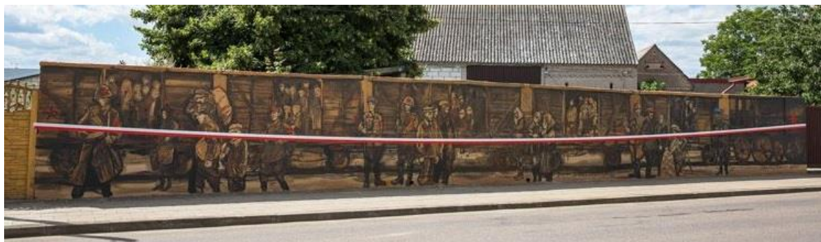
Mural zrealizowano przy współpracy ze Stowarzyszeniem Miłośników Ziemi Jedwabieńskiej

Na podstawie ustawy z dnia 24 kwietnia 2003 r. o działalności pożytku publicznego i o wolontariacie Rada Miejska w Jedwabnem Uchwałą Nr XXX/238/21 z dnia 5 października 2021 r. przyjęła do realizacji w 2022 roku Program współpracy Gminy Jedwabne z organizacjami pozarządowymi oraz podmiotami wymienionymi w art. 3 ust. 3 ustawy z dnia 24 kwietnia 2003 r. o działalności pożytku publicznego i o wolontariacie.